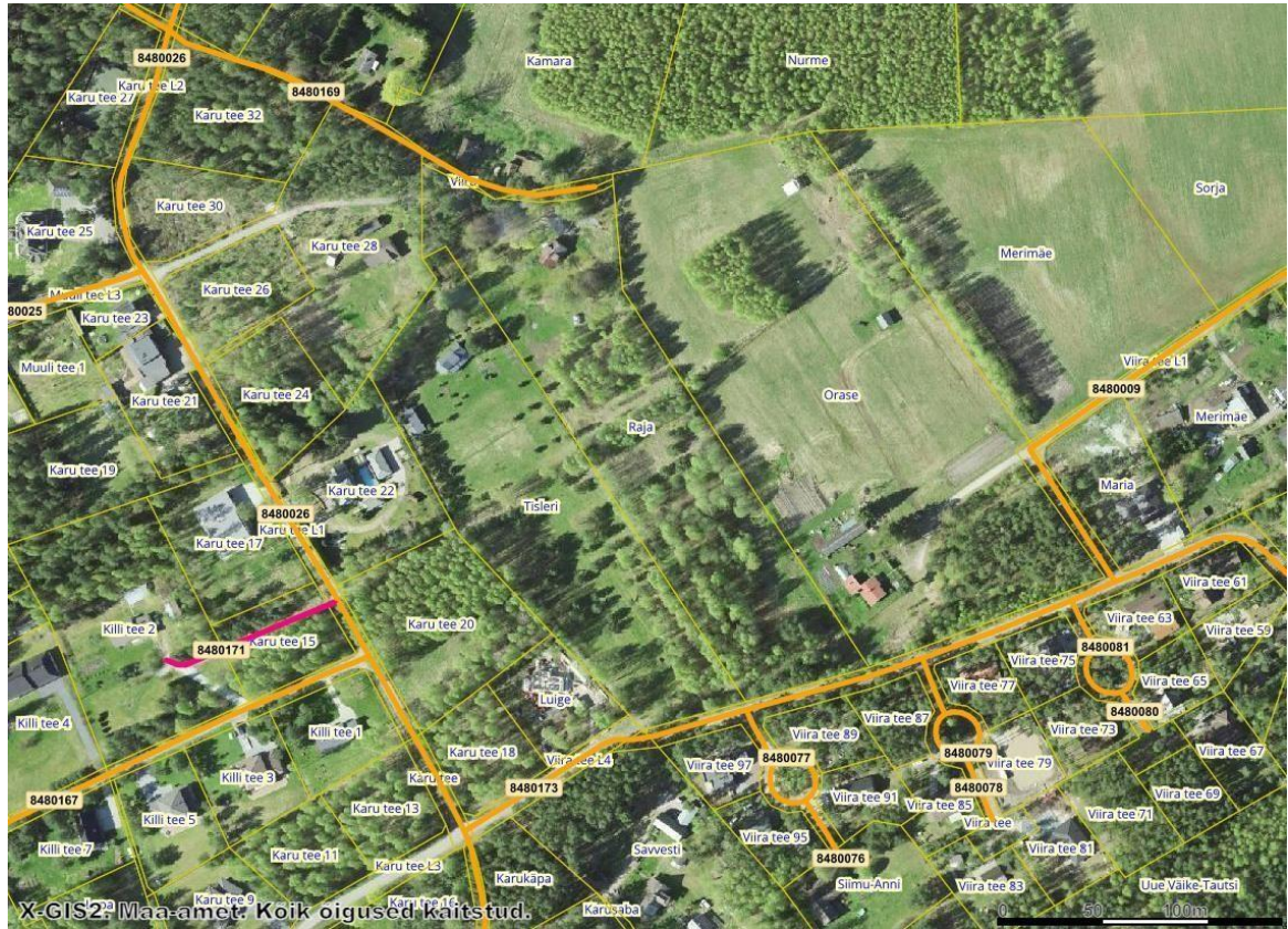
Joonis 4. Avalikud kohalikud teed märgitud oranžiga. (Allikas: Maa-Amet)

vajadustele võib parkimiskohtade arvu suurendada. Parkimine arvutada vastavalt standardile EVS 843:2016 „Linnatänavad“ tabel nr 9.2. Tee lahendust, täpset asukohta ning kõiki tee elemente on lubatud täpsustada projekteerimise faasis. Sõidusuunad ja planeeritud juurdepääs kinnistule on näidatud detailplaneeringu põhijoonisel. Planeeritav juurdepääsutee määratakse avalikku kasutusse ja võõrandatakse vallale.