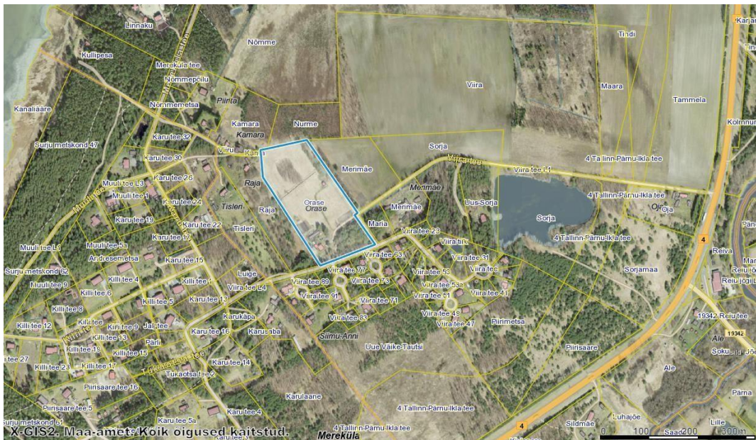
Joonis 1. Planeeringuala. Planeeringuala markeeritud sinise joonega

Maakasutus: Maa-ameti infosüsteemi kaardirakenduse kohaselt on Orase kinnistu 100 % maatulundusmaa (vt joonis 1). Kinnistu pindala on 3,10 ha, sellest 1,93 ha on haritav maa, 0,78 ha metsamaa, 0,31 ha õuemaad, 0,04 looduslik rohumaad ning 0,04 ha muud maa. Planeeringualal on olemasolevad hooned ning tehnovõrgud. Planeeringualale ulatub avalikult kasutatava tee kaitsevöönd 10 meetrit, elektripaigaldise kaitsevöönd, Reiu I maaparandussüsteemi maa-ala kitsendus ning olemasolevate puurkaevude hooldusalad. Juurdepääs kinnistule on tagatud lõunapoolsest küljest, avalikult kasutatavalt 8480173 Viira teelt. Orase maa-ala reljeef on valdavalt tasane ilma suuremate muutusteta. Maastiku kõrguste vahe on 7,5-10,0. Elamu ning abihoonete ehitamiseks pole vaja muuta kinnistu üldist reljeefi. Planeeringuala keskkonnaseisundit võib lugeda heaks. Planeeringuala asub hajaasustuses mitmete hoonestamata ning hajali majapidamistega hoonestatud maatulundusmaa sihtotstarbega kinnistute vahel.