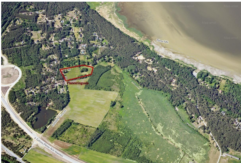
Joonis 2. Väljavõtte Maa-ameti fotolao lehelt.

Planeeringuala paikneb hajaasustus piirkonnas, Häädemeeste vallas, Reiu külas 4 Tallinn-Pärnu-Ikla maantee ja Pärnu lahe vahelisel alal. Planeeringualal on olemasolevad hooned ning tehnovõrgud. Ala on kaetud enamjaolt loodusliku rohumaa ning planeeringu lõunaosas puistuga. Planeeringuala asub hajaasustuses mitmete hoonestatud ja hoonestamata maatulundusmaa sihtotstarbega kinnistute vahel. Planeeringuala lähedase elumupiirkonna hoonestus on valdavalt viil- ja kaldkatustega kahekorruselised üksikelmud ning nende abihooned. Lähim bussipeatus „Reiu tee“ asub ca 1 km kaugusel planeeringualast, 4 Tallinn-Pärnu-Ikla maanteel.